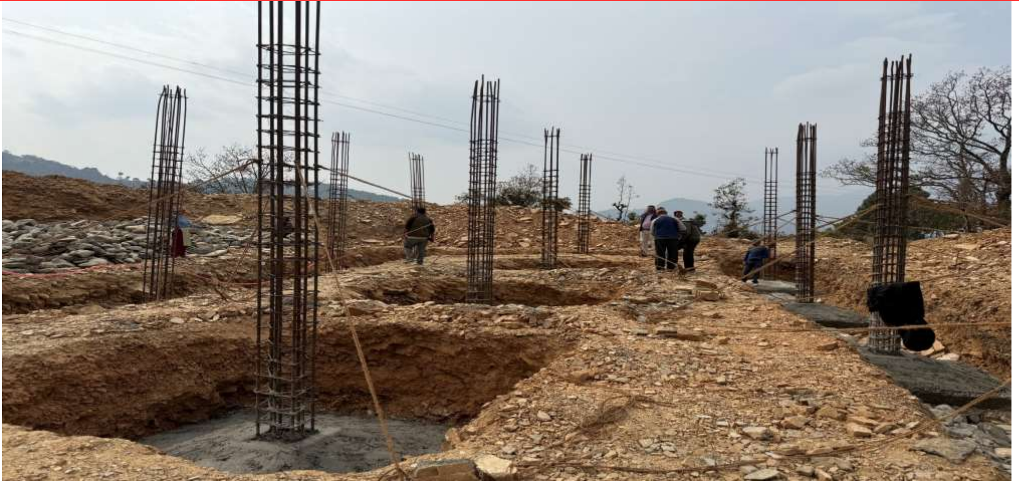
झिमरुक-३, कुटेडाडामा निर्माणाधिन ४ कोठे विद्यालय भवन