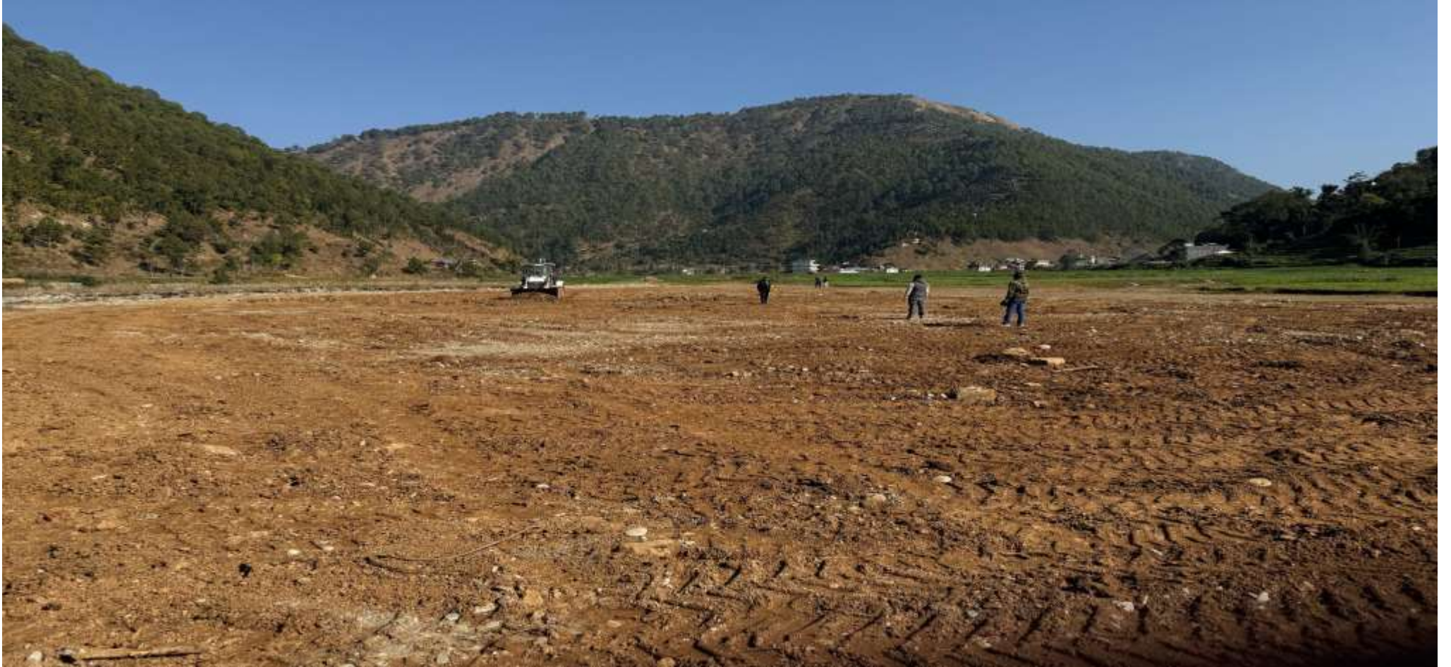
झिमरुक-5, मैनाके खेल मैदान