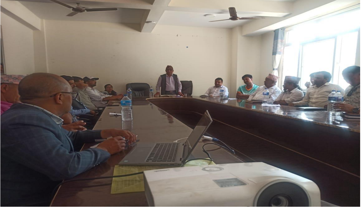
चित्र २: अभिमुखीकरण कार्यशाला गोष्ठी उपस्थित जनप्रतिनिधिहरु