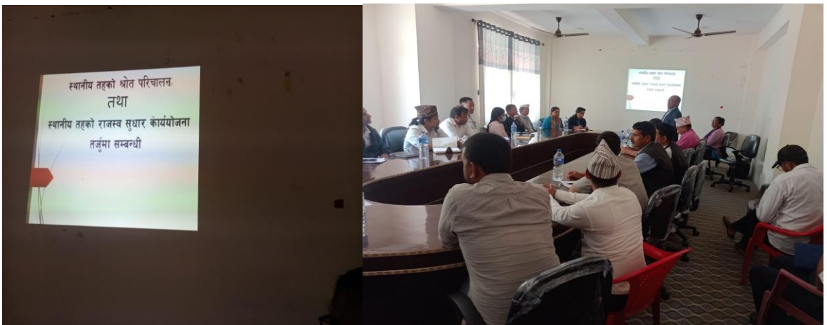
चित्र १: राजस्व परिचालन सम्बन्धी अभिमुखीकरण कार्यशाला गोष्ठी