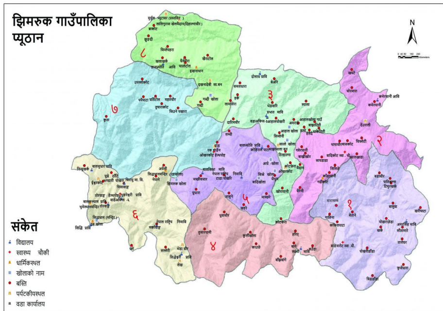
चित्र ६: झिमरुक गाउँपालिका भौगोलिक अवस्थिति

प्यूठान जिल्लामा अवस्थित करीब १०६.९३ व.कि.मी. क्षेत्रफल रहेको झिमरुक गाउँपालिकाको पूर्वमा गुल्मी जिल्ला पर्दछ भने, पश्चिममा नौबहिनी गाउँपालिका र प्यूठान न.पा. पर्दछ, उत्तरमा झिमरुक गाउँपालिका र नौबहिनी गाउँपालिका पर्दछन् र दक्षिणमा प्यूठान न.पा., मल्लरानी गाउँपालिका र अर्घाखाची जिल्ला पर्दछन् । जंगल तथा जलाधार क्षेत्रको कमी नभएको यस गाउँपालिकाको परिसरमा सानाठूला गरी आधा दर्जन भन्दा बढी खोला तथा नदीहरु रहेका छन् । यो झिमरुक गाउँपालिका मिति २०७३/११/२२ गते नेपाल सरकार मन्त्रिपरिषद्को निर्णय बाट झिमरुक गाउँपालिका रहन गएको हो । यो समुन्द्री सतह ८६८ देखि २१९९ मि. को उचाईमा, काठमाडौँदेखि लगभग ४२४ कि.मि. को दूरीमा स्थित छ । झिमरुक गाउँपालिकामा कूल ८ वडा रहेका छ ।