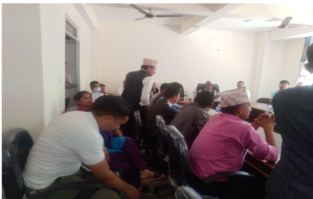
चित्र ४: राजस्व परिचालन सम्बन्धी सरोकार वाला पक्षसंग छफल